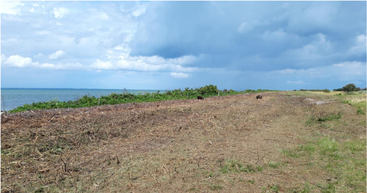
Knusning af rynket rose med efterfølgende afgræsning med gutefår og shetlandsponyer på Øvre. Horsens Kommune.

Effekten af indsatserne bliver løbende vurderet i det Nationale Overvågningsprogram for Vandmiljø og Natur (NOVANA), som overvåger vandmiljøets og naturens tilstand inden for de områder, der prioriteres i forhold til de politisk fastsatte økonomiske rammer.