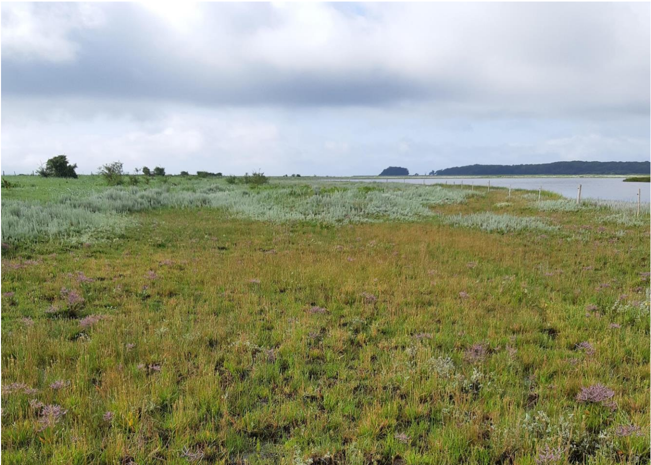
Afgræsset strandeng (1330) i Odder kommune med bl.a. lav hindebæger. Naturtypen strandeng udgør over halvdelen af den lysåbne habitatnatur i Natura 2000-området N56 Horsens fjord, havet øst for, og Endelave. Odder kommune.

Odder Kommune har opsat færdsel forbudt skilte på Alrø, v. holmene. Skiltene er opsat således at færdsel i fuglenes ynglesæson reguleres bedre. Odder kommune har desuden opsat vildtkameraer på holmene, for at kortlægge omfanget af prædation på ynglelokaliteterne.